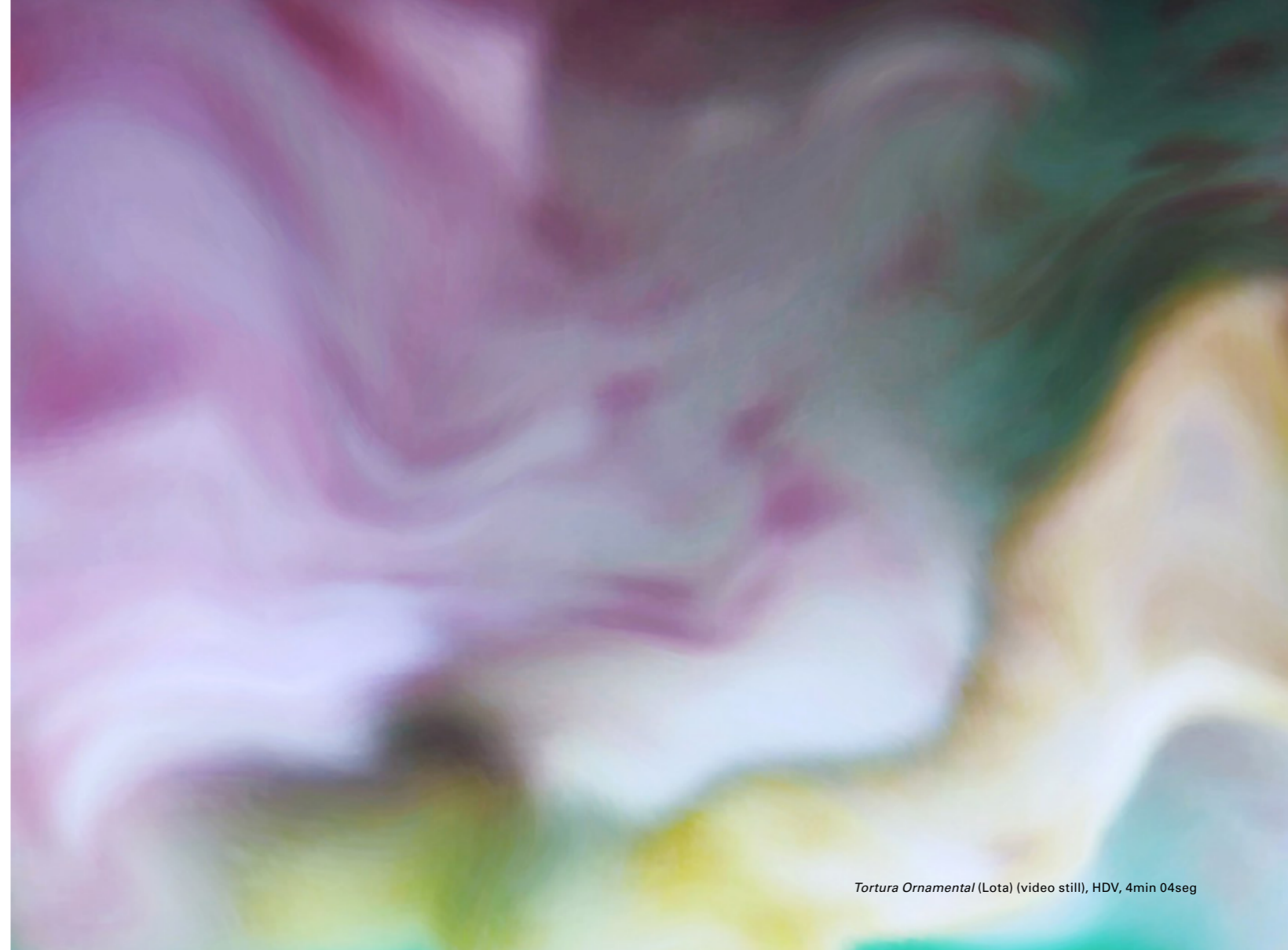
Tortura Ornamental (Lota) (video still), HDV, 4min 04seg