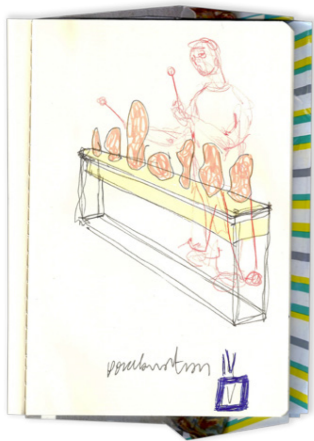
Apuntes de Proceso, Porcelanatron IV - V , 2019