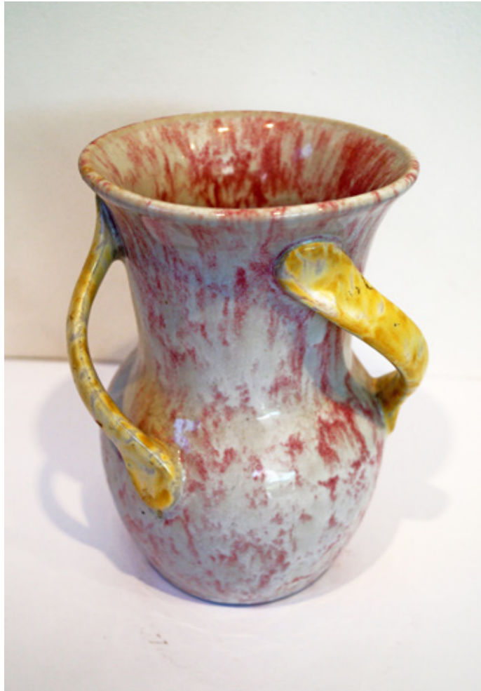
Florero (Cerámica esmaltada, Lota) Colección Privada