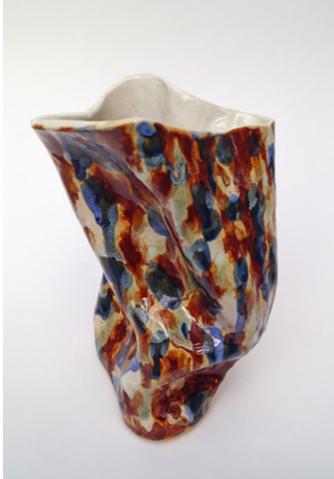
Tortura Ornamental (Re C5) , Cerámica gres esmaltada, 2019