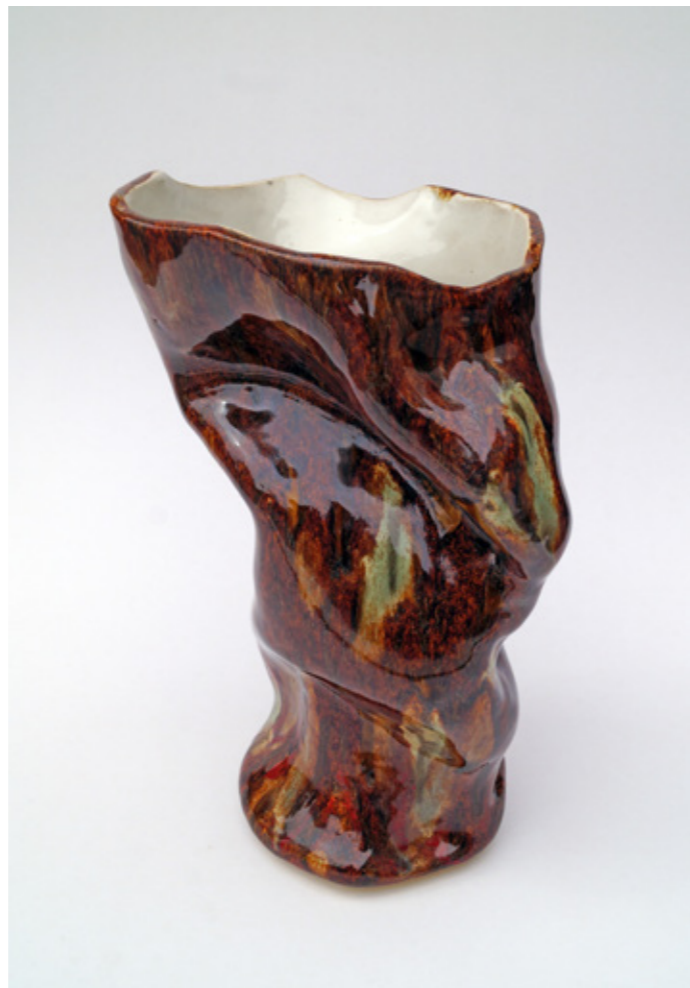
Tortura Ornamental (Re# C5) , Cerámica gres esmaltada, 2019