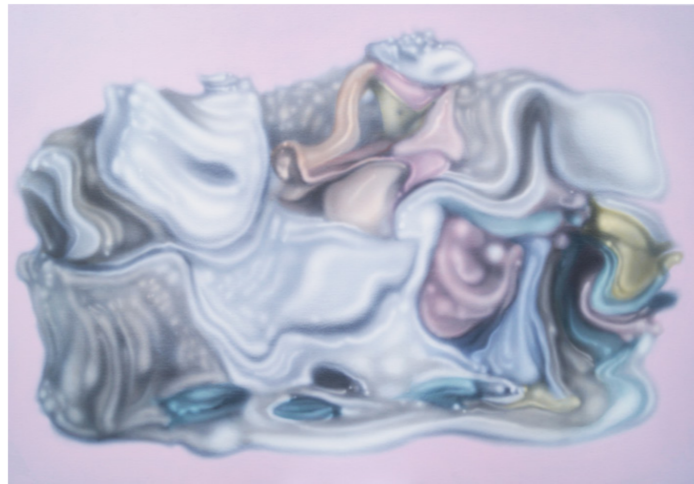
Schadenfreude Series , Óleo y acrílico sobre tela, 100 x 150 cms, 2017

El título de la muestra corresponde a una cita de Michel de Certeau extraída de “La Invención de lo Cotidiano”, donde el autor desarrolla su noción sobre las resistencias que cada individuo puede ejecutar al interior de la esfera de la cotidianidad. Así, Cabieses-Valdés aplica los conceptos de estrategia y táctica a partir de las reflexiones expuestas por de Certeau hacia el imperio de lo decorativo, dejando entrever la posibilidad de transformación y activación de aquellos productos ornamentales impuestos por la dominación de un “gusto” forzado culturalmente.