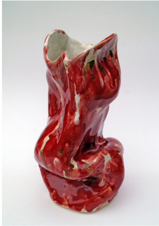
Tortura Ornamental (Do# C2), Cerámica gres esmaltada, 2019

La individualidad del propietario expresada en cada ornamento...Esto es lo que significa vivir la vida con el cadáver propio a cuestas.