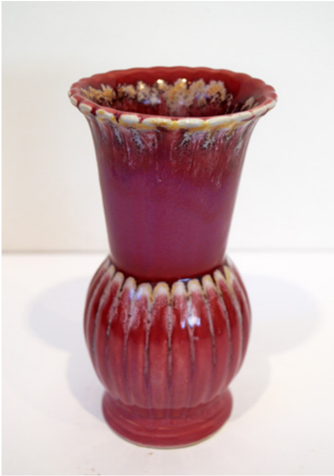
Florero (Cerámica esmaltada, Lota) Colección Privada