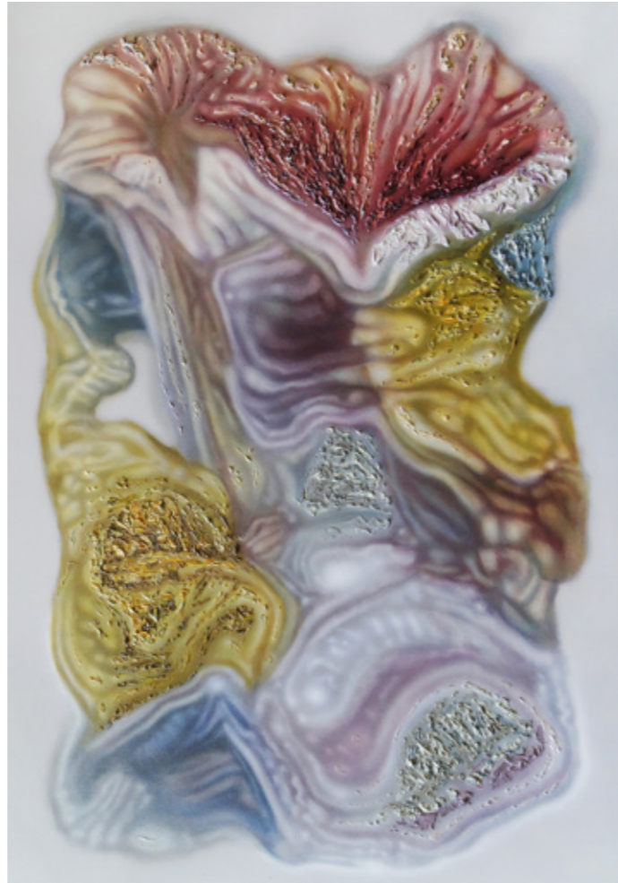
Serie Schadenfreude (Lota), Óleo y acrílico sobre tela, 180 x 115 cms, 2019