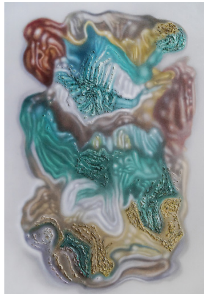
Serie Schadenfreude (Lota) , Óleo y acrílico sobre tela, 180 x 115 cms, 2019