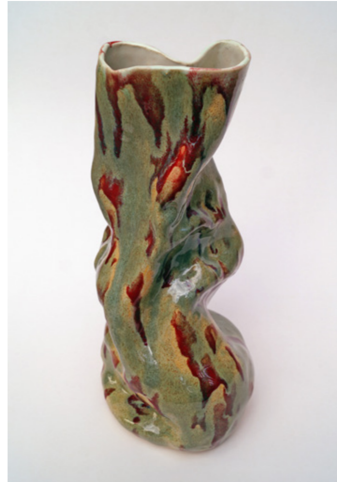
Tortura Ornamental (Re# C5), Cerámica gres esmaltada, 2019