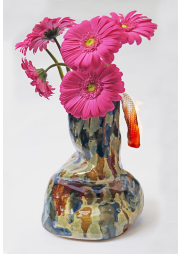
Sin Título , Impresión Digital, 2020