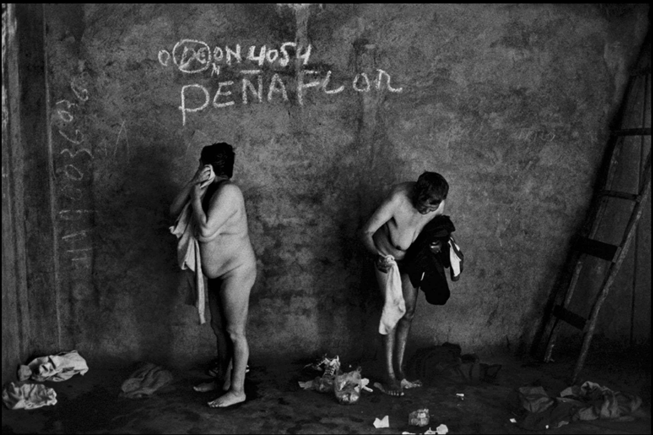
Baño X, de la serie Antesala de un desnudo, 1999, fotografía de Paz Errázuriz.