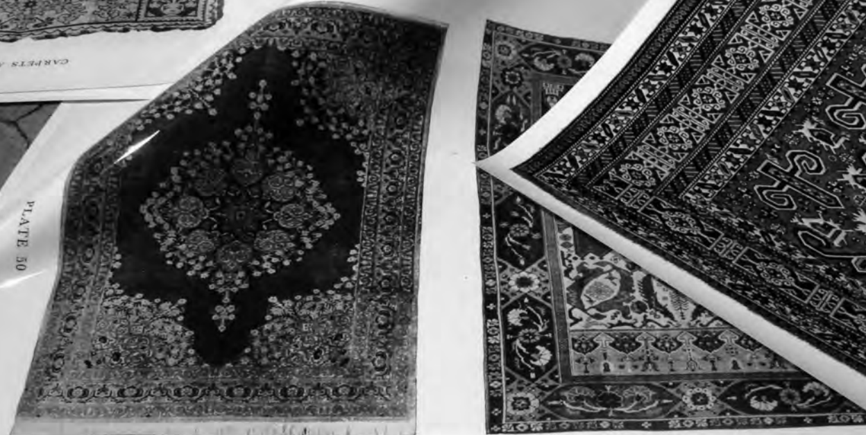
(A) Tabriz rug. A typical example showing medallion on plain field. Perez Ltd.