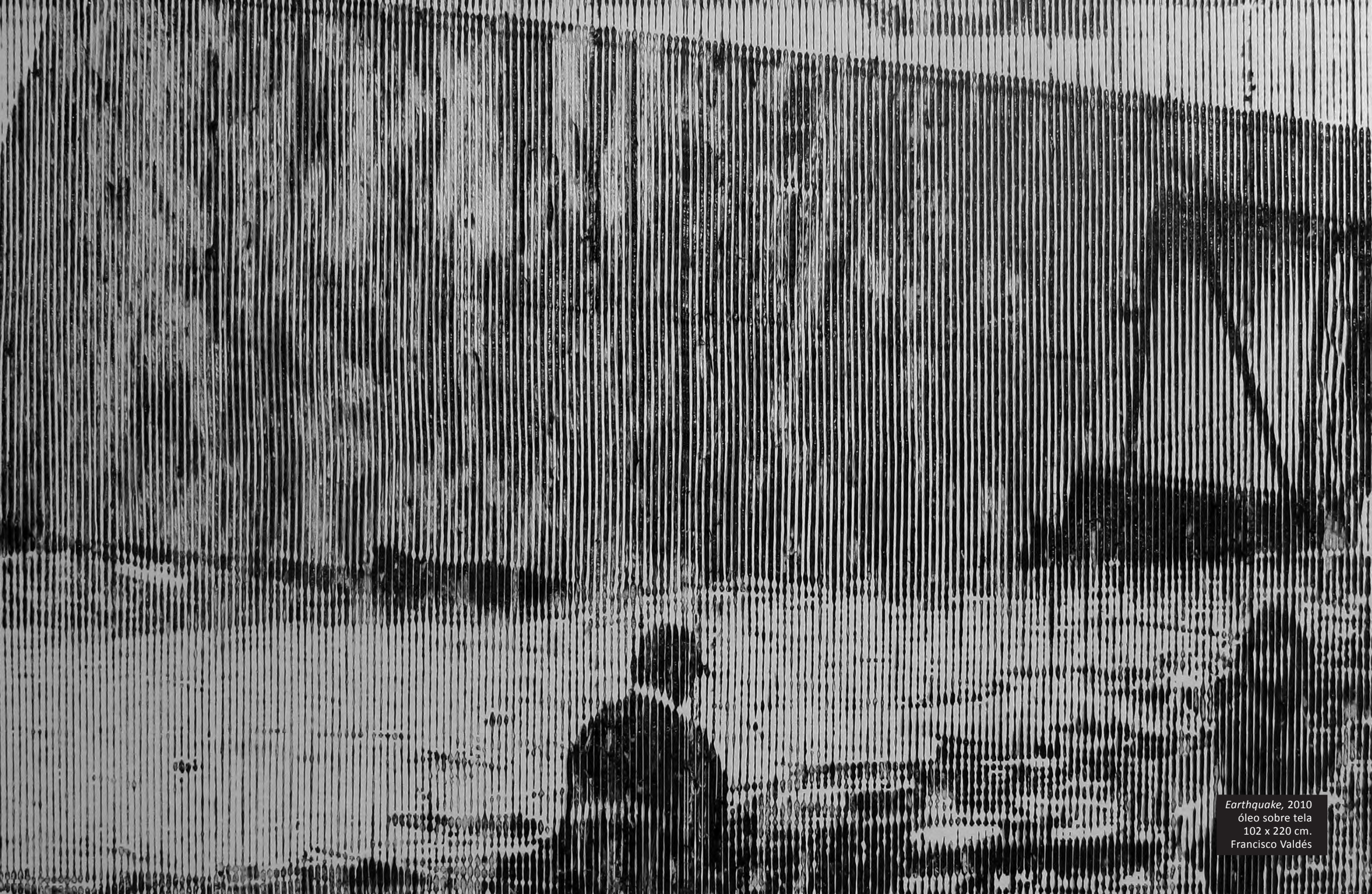
Earthquake , 2010 óleo sobre tela 102 x 220 cm. Francisco Valdés