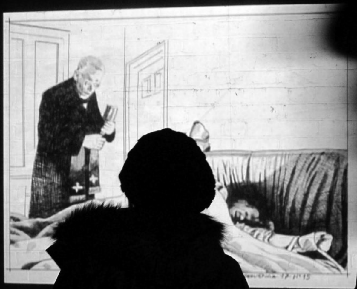
Reagan 1973, 2003 video-animación dimensiones variables Francisco Valdés