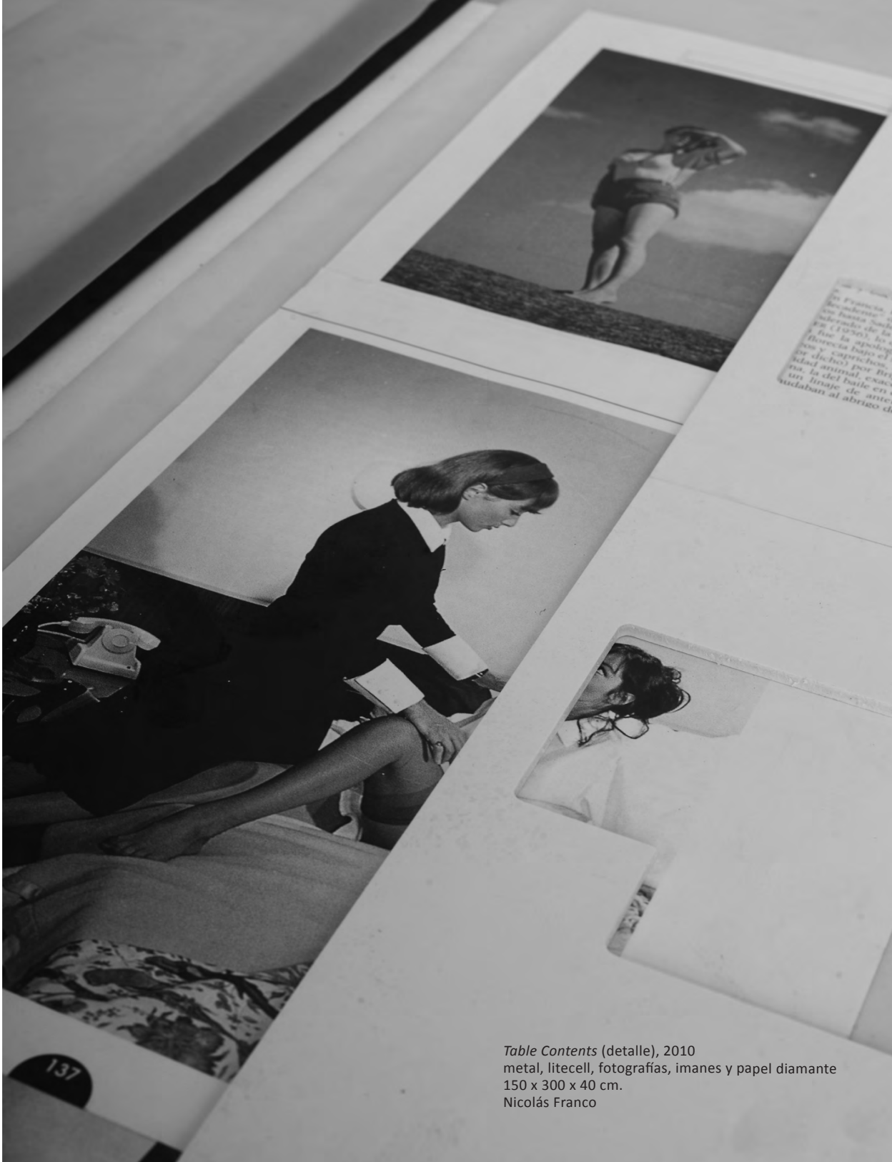
Table Contents (detalle), 2010 metal, litecell, fotografías, imanes y papel diamante 150 x 300 x 40 cm. Nicolás Franco