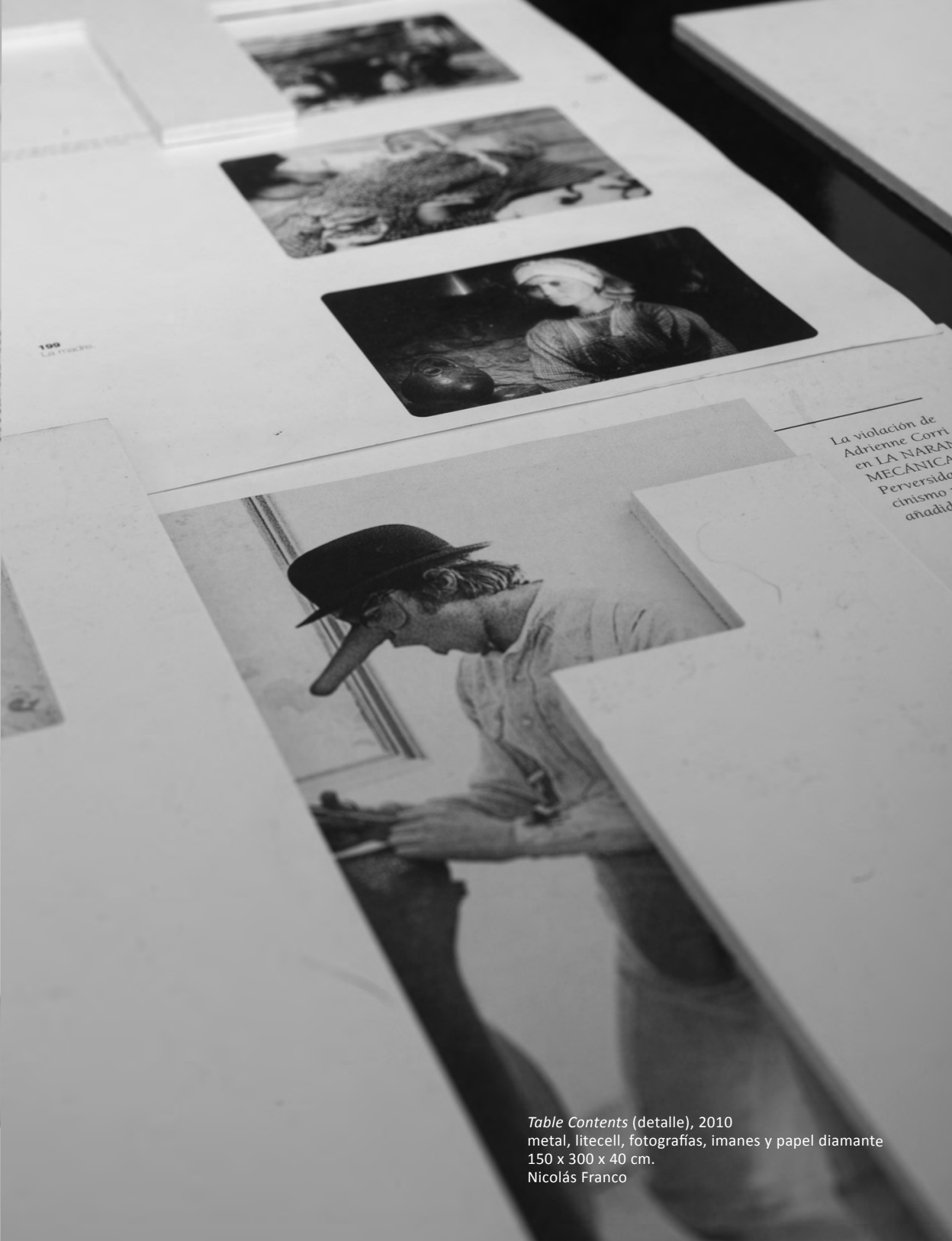
Table Contents (detalle), 2010 metal, litecell, fotografías, imanes y papel diamante 150 x 300 x 40 cm. Nicolás Franco