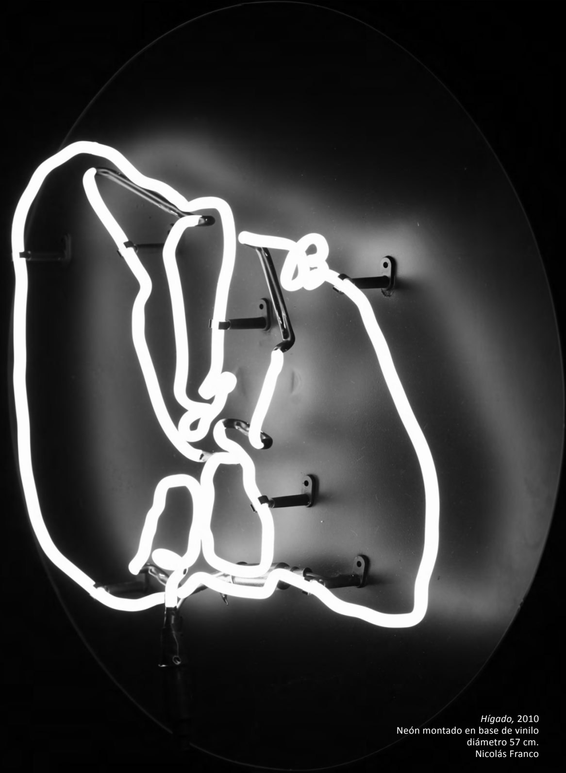
Hígado, 2010 Neón montado en base de vinilo diámetro 57 cm. Nicolás Franco

Director Pedro Montes Directora ejecutiva Florencia Loewenthal Diseño Pamela Ipinza Fotografías Nicolás Franco Rodrigo Maulén V.