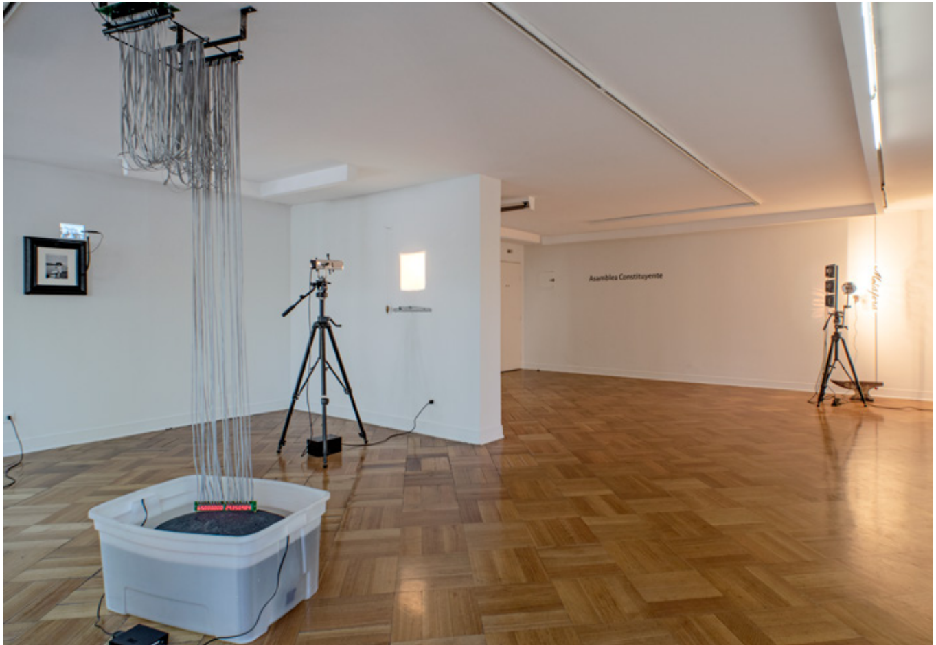
El Fin de la Historia