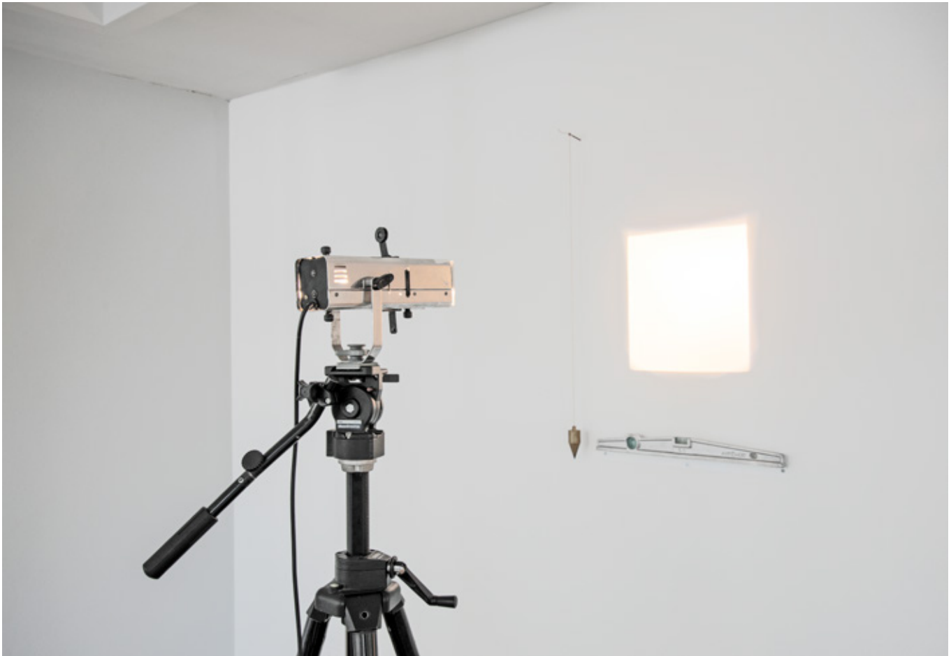
El Último Cuadro de Malevich